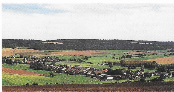
Le village de Cheveuges vu de La Boulette

Départ entre l'école "Alice Warinet" et l'église romane (XII ème siècle). Se diriger vers l'ouest et la fontaine du "Vivier". S'engager aussitôt sur un chemin qui monte vers la droite. En haut, en face d'un chalet, tourner à droite jusque la "Boulette". Emprunter la D 977 et passer devant le parking et la table d'orientation. Descendre jusqu'au premier croisement, suivre le PR n°5 et regagner Cheveuges.