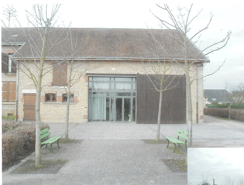
Salles et cuisine