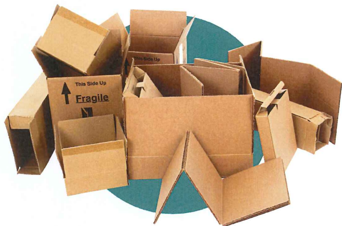
Grands emballages en carton