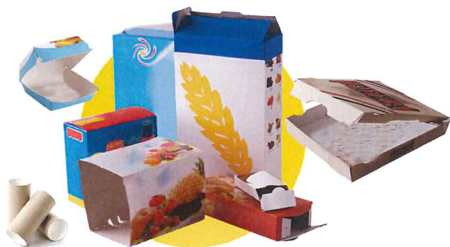
Petits emballages en carton